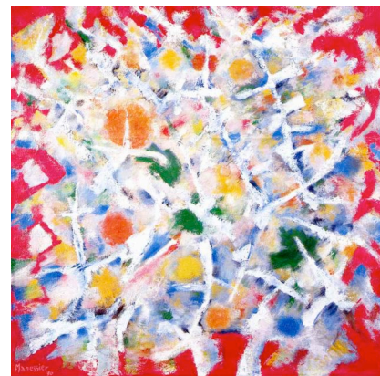
Alléluia , huile sur toile, 1976, H.60 x L.60 cm

Ouverture de 10 h à 18 h, tous les jours sauf le dimanche. www.museedelaposte.fr